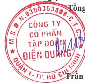
Trần Quốc Toàn